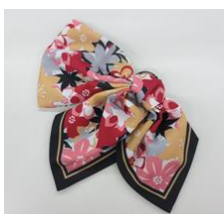
案内制服スカーフ

地域をイメージするモチーフ「桃の花（岡山）・もみじ（広島）・梨の花（鳥取）」を幾何学柄にアレンジしたオリジナル柄のスカーフ。