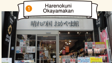
1 Harenokuni Okayamakan

最适合选购冈山特产！这里是经营着大量冈山特有食品及工艺品等“冈山好产品”的精品店。 TEL:086-234-2270 营业时间:10:00-19:00 定期休息日:星期二(若为节假日则营业)