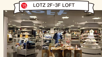
15 LOTZ 2F·3F LOFT

这里有世界一流的的品牌，也只有在这里才能买到的商品。 TEL: 086-231-1038 营业时间:11:00-19:30 定期休息日:星期二