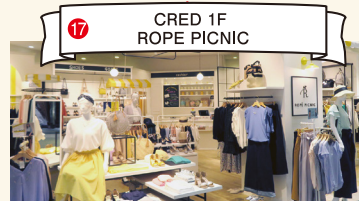
17 CRED 1F ROPE PICNIC

从一般书籍、杂志、漫画、专业书籍，到CD、DVD、文具、备货品种丰富，您可以在这里慢慢挑选心仪的书籍等等。 TEL:086-212-2551 营业时间:10:00-20:00