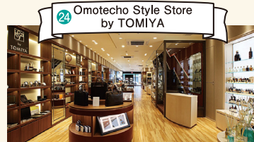
24 Omotecho Style Store by TOMIYA

冈山最好的包袋&钱包专卖店。商品以人气品牌PORTER等日本产的皮革产品为主。数量多达2,000件。非常具有吸引力。 TEL:086-231-0101 营业时间:10:00-19:30 定期休息日:星期二